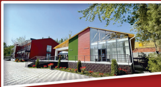
Congress Resort OshSU