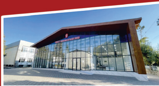
“КЕЛЕЧЕК МУУНДУН ХАБЫ” борбору