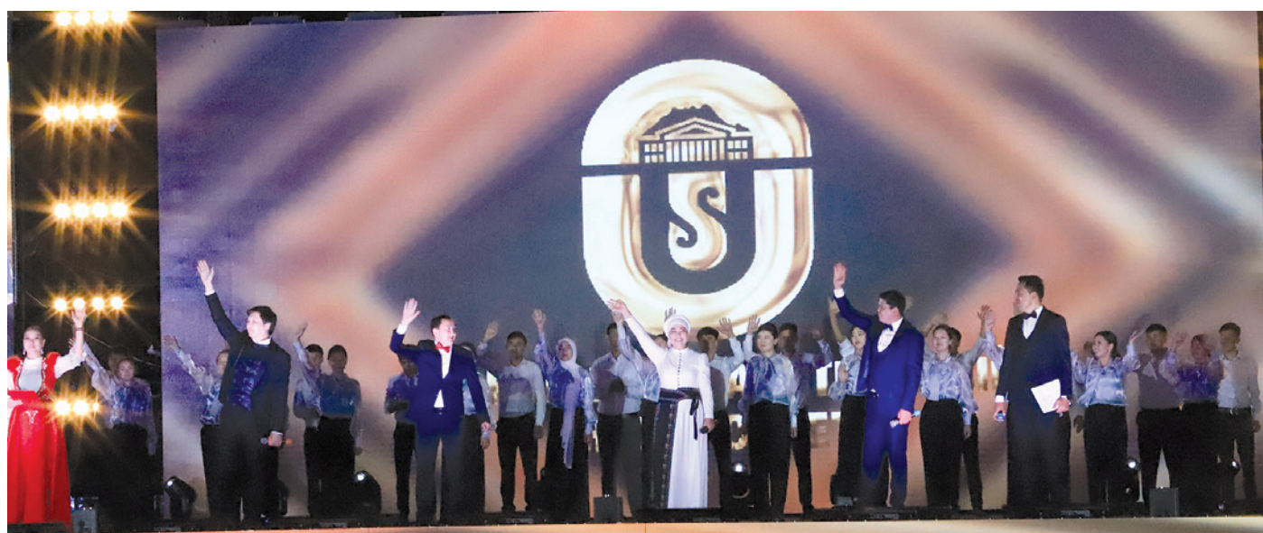
ОшМУнун 85 жылдык мааракеси