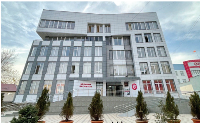
Медицина факультетинин кошумча окуу корпусу