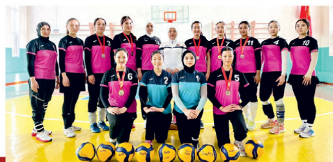
“ОшМУ - Университет” кесипкөй кыздар волейбол клубу КРдин волейбол боюнча Улуттук лигасынын 3 жолку чемпиону