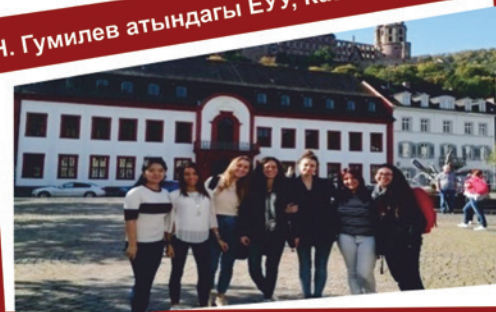
Марбург университети, Германия