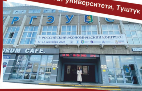
Урал мамлекеттик экономикалык университети, Россия