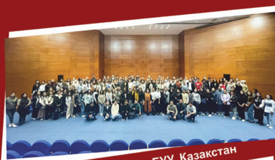
Л.Н. Гумилев атындагы ЕУУ, Казакстан

Олимпиаданын, эл аралык фестивалдардын, спорттук мелдештердин жеңүүчүлөрүнө атайын белгиленген акчалай сыйлыктар каралган. Ошондой эле социалдык колдоого муктаж студенттерге 5 000 000 сомдон ашуун колдоолор көрсөтүлүп келет.