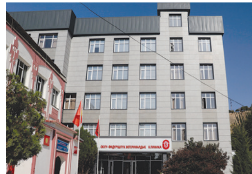
Табият таануу, туризм жана агрардык технологиялар факультетинин ветеринардык клиникасы