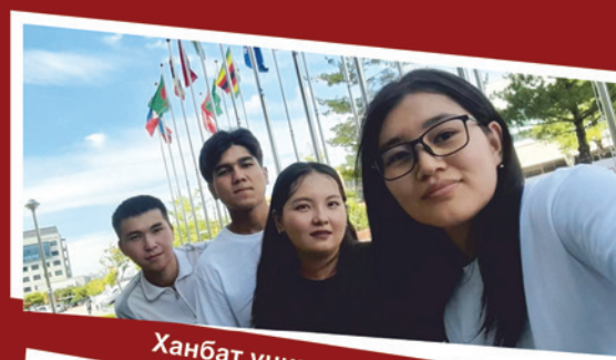
Ханбат университети, Түштүк Корея