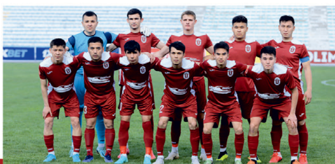
“ОшМУ” кесипкөй футбол клубу