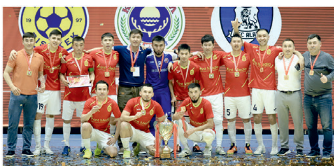
ОшМУнун футбол боюнча кесипкөй курама командасы 2024-жылы клубдар арасында өткөрүлгөн КРдин кубогунун жеңүүчүсү