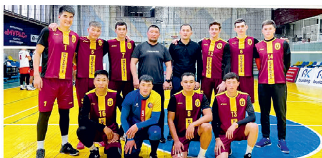
“ОшМУ - Университет” кесипкөй волейбол клубу КРдин волейбол боюнча Улуттук лигасынын 2023-жылкы чемпиону

Студенттик өзүн-өзү өнүктүрүү борборлору студенттердин тажрыйбасын байытат, жеке жана кесиптик максаттарына жетүүгө жардам берет.