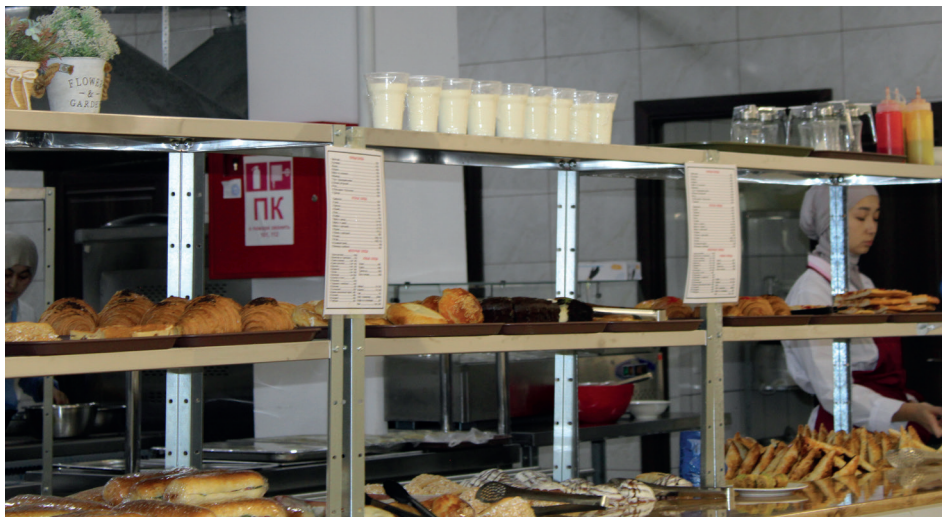
Айганыш Нурлан кызы