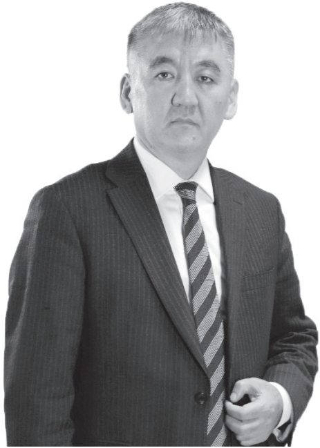
Кадырлуу агай-эжейлер, илимпоз устаттар, кесиптештер!

Сиздерди кирип келе жаткан 2023-жыл Жаңы жылыңыздар менен менен ак дилимден куттуктаймын! Босогобузда турган жыл ырыс-кешиктүү, жакшылыктарды жыллоолгон, ийгиликтерди ыроологон ак жолтой жылдардан болсун.