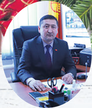
Урматтуу ОшМУнун кызматкерлери жана студенттери!

Эски жылды узатып, жаңы жылды тосуп алуу алдында турабыз. 2024-жыл ОшМУ үчүн жакшы жылдардан болду. Окуу жайдын 85 жылдык мааракесин жогорку деңгээлде өткөрүп алдык. Ал эми профсоюз комитети жалпы жамаатыбызга мүмкүнчүлүккө жараша жардам бердик жана колдоо көрсөттүк. Атап айтсак, Ыссык-Көл облусунун Түп районундагы “Үмүт” пансионатына капиталдык оңдоо жүргүзүлдү жана жаңы коттеждер салынды. “Ак Буура” эс алуу борбору жаңы имараты, бассейни, ашканасы заманбап шарты менен кайрадан курулду. Жайкы эс алуу мезгилинде жамааттын атынан Ыссык-Көлгө 400дөн ашуун кызматкер, ал эми ОшМУнун клиникасында, Жалал-Абад, Мамакеев, Керемет эс алуу санаторияларында 250дөн ашуун кызматкерлер профсоюз комитетинин колдоосу менен барып келишти. Спорттук жана маданий массалык иш чараларды жана материалдык жардам сурагандарды тынымсыз колдоп бердик.