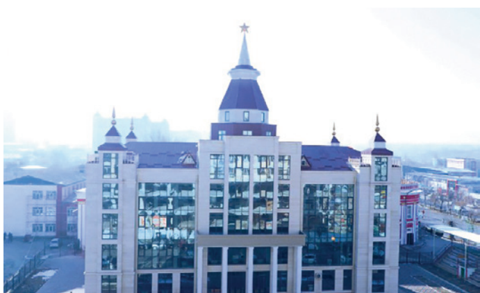
Эл аралык билим берүү программалары жогорку мектеби