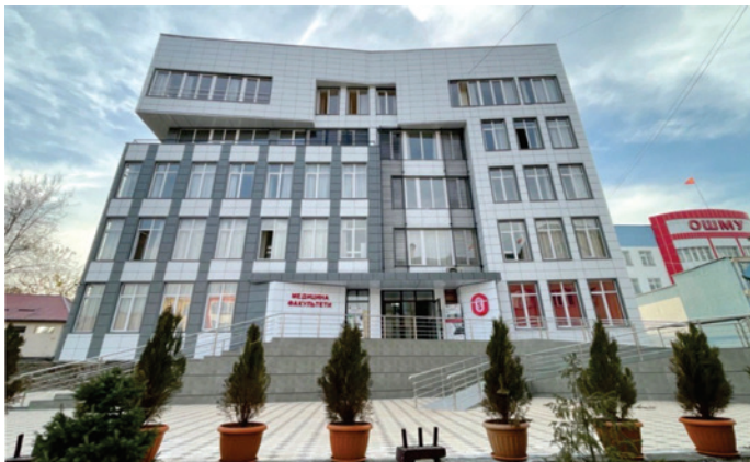
Медицина факультетинин кошумча окуу корпусу