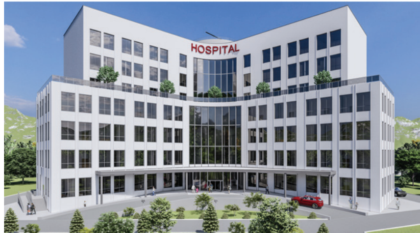
ОшМУнун курулуп жаткан медициналык клиникасы