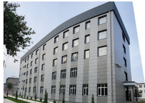
Табият таануу, туризм жана агрардык технологиялар факультетинин ветеринардык клиникасы