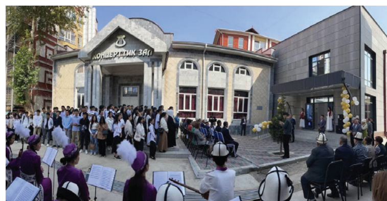
Искусство факультетинин кошумча корпусу