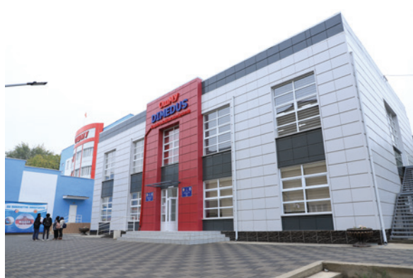
Dimedus окуу-лабораториялык корпусу