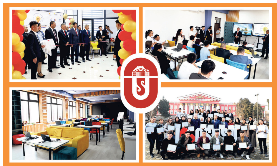
Чоң университет – чоң мүмкүнчүлүк!