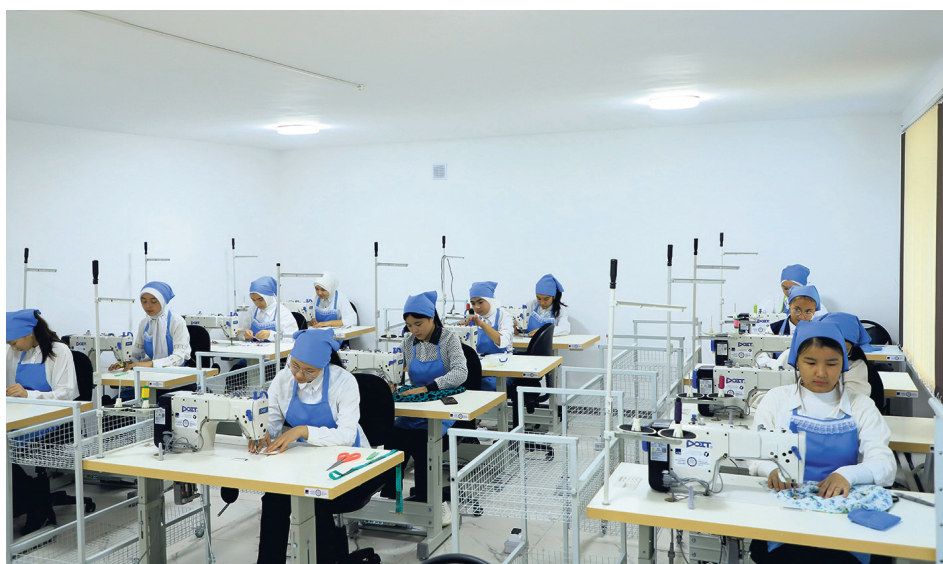
БИЛИМ, ИЛИМ, ӨНДҮРҮШ!