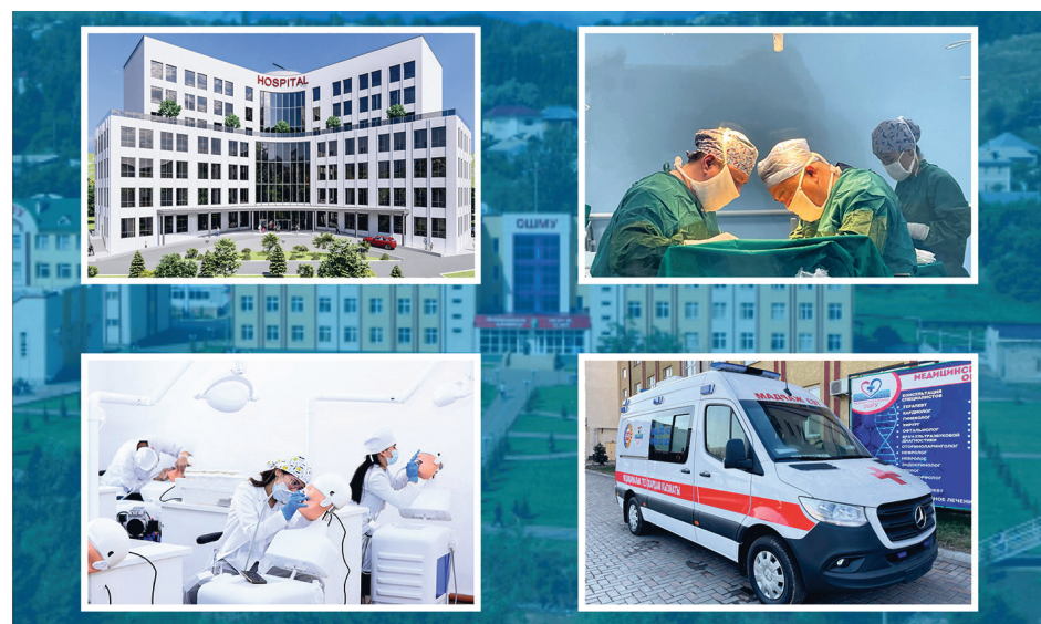
Университет калктын ден соолугу үчүн кам көрөт