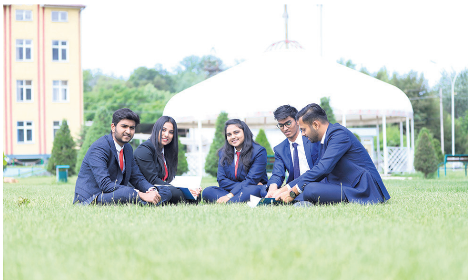
ОшМУ – горизонтторду кеңейтет