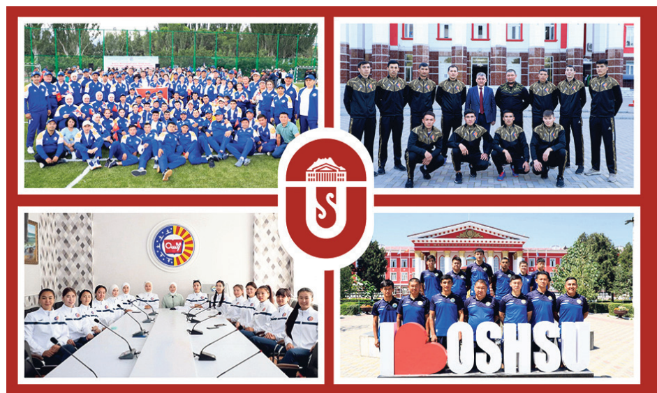
2023-жыл – Сергек жашоо жана ден соолук жылы