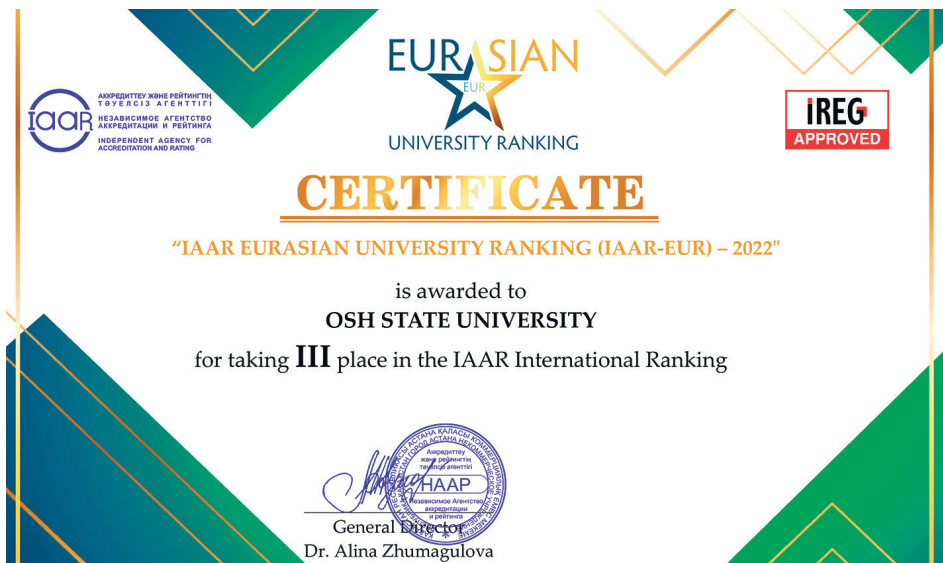
Евразиядагы эң мыкты 3 университеттин катарында