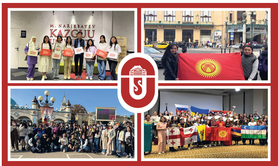
Академиялык мобилдүүлүк программасы