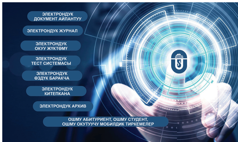
ОшМУ – санарип мейкиндигинде