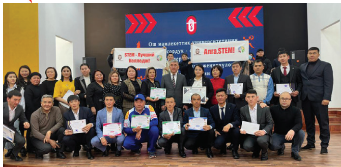
ОшМУнун профессордук-окутуучулары арасындагы спорткайданын жыйынтыгы боюнча II орун