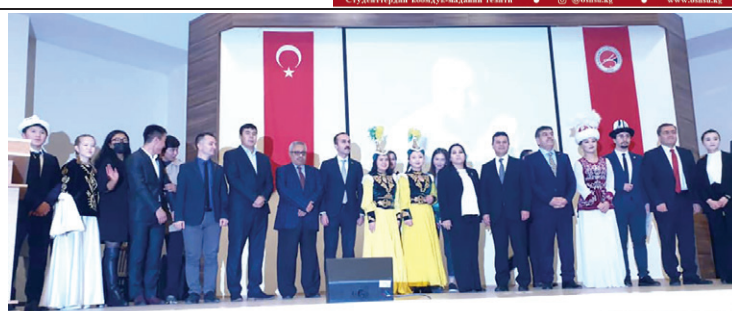
Туркия мамлекетинин Кастамону университетинде Ч.Айтматовдун 93 жылдыгына арналган иш-чарада