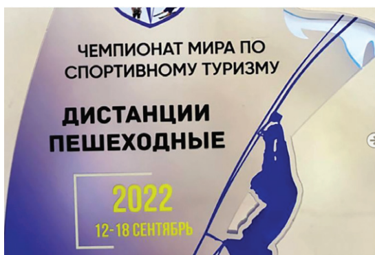
Өзбекстандын Джизах облусунун Бахмал районунда спорттук туризм боюнча дүйнө чемпионатында III орун