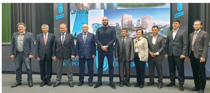
Биздин окутуучулар Казакстандын Астана шаарындагы Сатбаев университетинде тажрыйба алмашуу учурунда